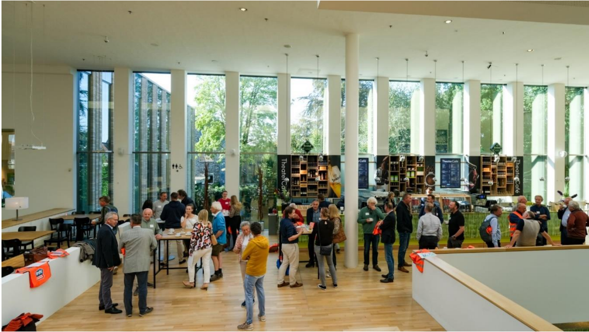
Ontvangst in DNK Assen