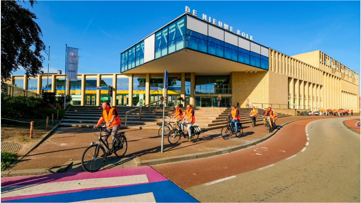
Vertrek bij De Nieuwe Kolk 'op fietse'