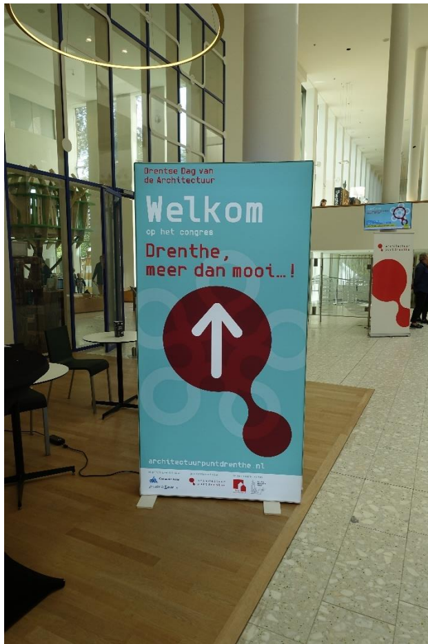
Ontvangst in DNK Assen

Na terugkomst werd de groep verwelkomd voor een lunch.